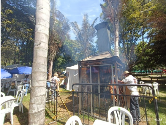
Fotografía 3. Horno que opera con leña (emisiones fugitivas visibles) – Vista 2