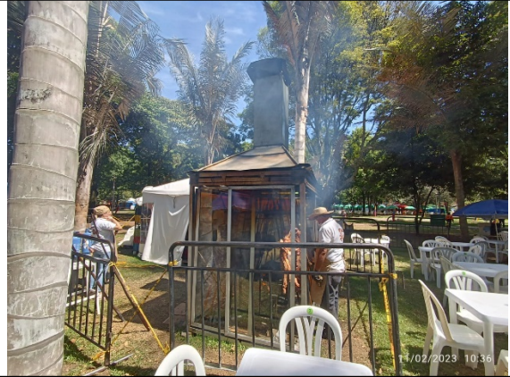
Fotografía 2. Horno que opera con leña (emisiones fugitivas visibles) – Vista 1