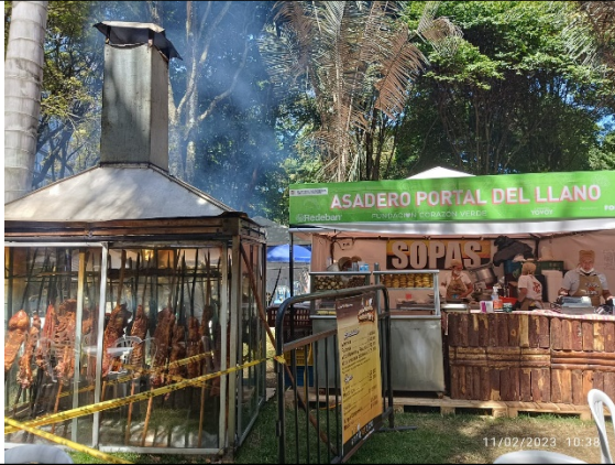
Fotografía 1. Fachada del stand