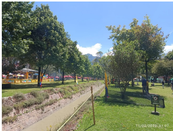
Fotografía 6. Vista general Parque Zonal Canal El Virrey