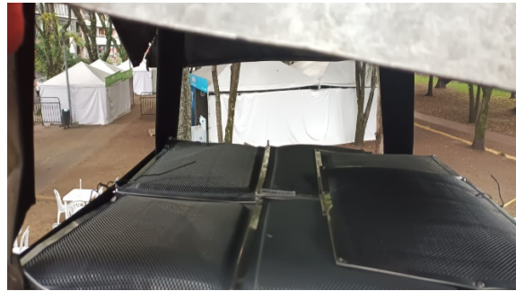
Fotografía 4. Filtros de carbón activado en horno que opera con leña