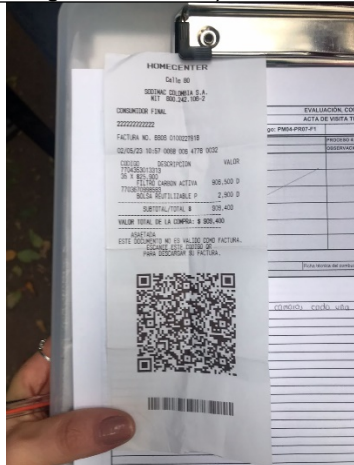
Fotografía 5. Factura de compra filtros de carbón activado